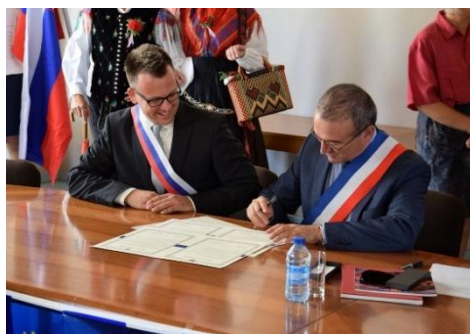
Crest, 2015: podpis pobratitvene listine

Medvode so pobratene s francoskim mestom Crest, ki se nahaja v departmaju Drôme ( povezava ), katerega provansalski del prekrivajo čudovito dišeča polja sivke ( povezava ). Kot učencu francoščine se ti torej ponuja izvrstna priložnost, da svoje znanje poglobiš na mednarodnih izmenjavah ter sodeluješ v različnih projektih prijateljskih mest ( povezava ).