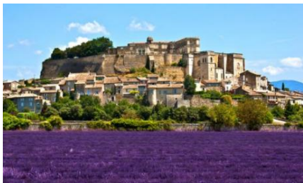
Drôme: grad Grignan

In še nekaj: francoščina ni težka, saj več kot pol besed najdemo v angleškem jeziku, veliko pa jih poznamo tudi iz slovenskega: garaža, kurir, bageta, fasada, balet, balon, bonbon, čokolada, terasa... Ugani, kaj pomenijo naslednje besede: vitrine, radio, télévision, chef, parc, bon appétit, directeur, plage, café, téléphone, football, banane!